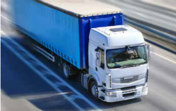
Abb. 6: Je nach Art eines Produkts entsteht ein grosser Anteil der Verbräuche schon früher in der Lieferkette, zum Beispiel beim Transport der Rohstoffe.