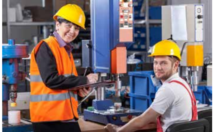
Abb. 1: Nur wer einen Überblick über die Produktionsprozesse hat, kann auch Verbesserungspotenziale erkennen.