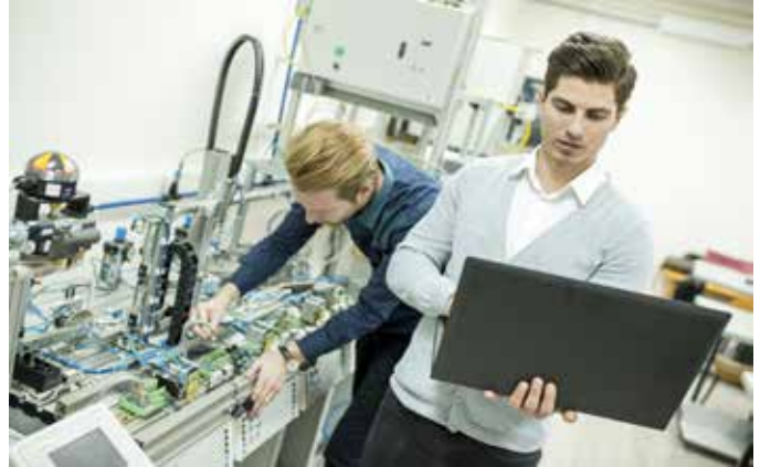
Abb. 15: Gutes Ressourcenmanagement ist Teamarbeit

Mit dem Erfassen von Kennzahlen haben Sie bereits die erste und schwierigste Hürde zu mehr Effizienz gemeistert. Sobald die grössten Einsparpotenziale erst einmal identifiziert sind, kann es mit der Optimierung losgehen.