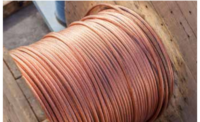
Abb. 10: Nicht nur bei Edelmetallen lohnt sich der effiziente Umgang mit Rohstoffen: Jeder Verlust von Ausgangsmaterialien führt zu unnötigen Ausgaben.