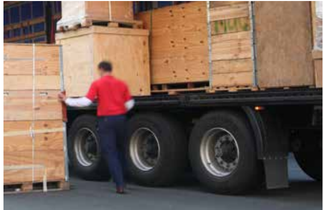
Abb. 5: Als Bezugsgrösse eignet sich für viele Kennzahlen die Produktionsmenge. Damit wird sichtbar, wie viel der eingesetzten Rohstoffe im Produkt enthalten sind.