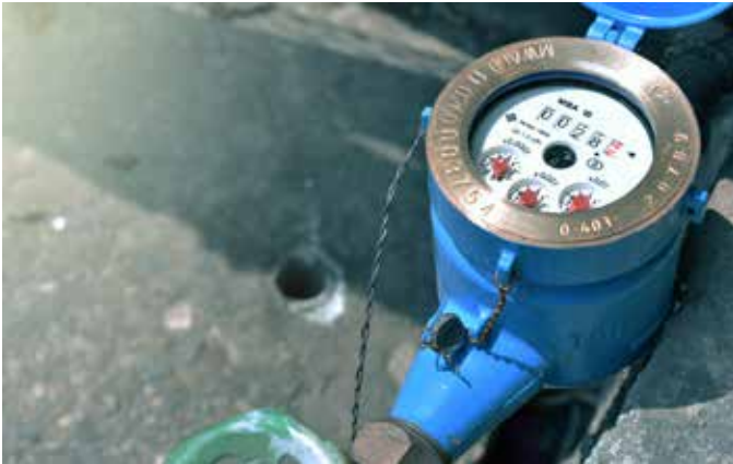
Abb. 2: In ressourcenbewussten Betrieben sind Messgeräte wichtige Arbeitsinstrumente.

In einer wettbewerbsorientierten Marktwirtschaft sind Betriebe immer wieder mit der gleichen Fragestellung konfrontiert: Wo können unsere Ausgaben minimiert, wo Einnahmen erhöht werden? Gleichzeitig steigen die Erwartungen von InvestorInnen, VertragspartnerInnen, Behörden, KonsumentInnen, MitarbeiterInnen und weiteren Anspruchsgruppen an die Umweltleistung von Betrieben. Dieses Abwägen zwischen Ökonomie und Ökologie stellt eine grosse Herausforderung dar.