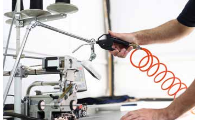
Abb. 7: Bei der Verwendung von Druckluft fallen in gewissen Branchen hohe Energiekosten an.

Relative Kennzahlen eignen sich gegenüber den absoluten besser für Vergleiche und bieten Grundlage für Entscheidungen, weil sie auf einem einheitlichen Massstab beruhen. Man kann mit ihnen zeitliche Veränderungen beobachten (Monitoring), den Erfolg von Massnahmen sichtbar machen oder sich mit Mitbewerbern messen. Auch für den Vergleich mit Benchmarks (z.B. zur Beschreibung des Stands der Technik) werden relative Kennzahlen benutzt.