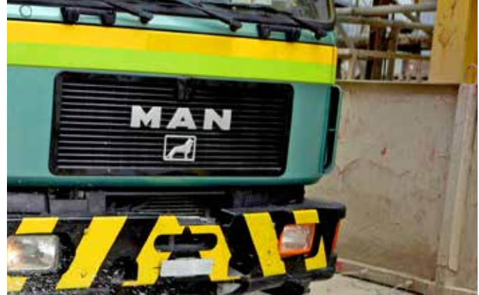
Abb. 11: Radreinigung eines Fahrzeugs in einem Entsorgungsunternehmen.

Wasser ist eine besondere Ressource: Zum einen wird es als Rohstoff eingesetzt (z.B. in der Getränkeindustrie), zum anderen ist Wasser auch ein Lösungsmittel bei Reinigungsprozessen, ein Kühl- oder ein Transportmedium. Dabei wird es oft verschmutzt und muss aufbereitet werden.