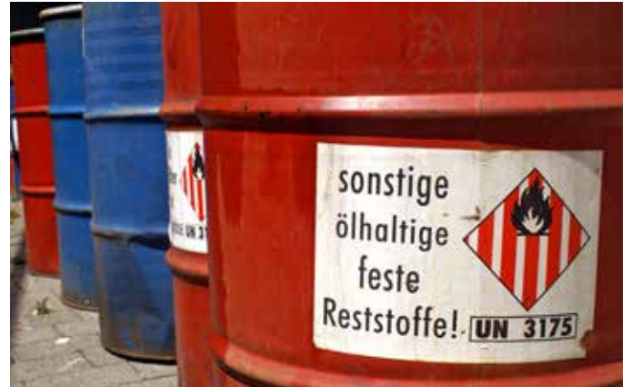
Abb. 13: Gerade Abfälle, welche aufgrund ihrer gefährlichen Eigenschaften mit grosser Sorgfalt behandelt werden müssen, haben hohe Entsorgungskosten.

Abfälle sind neben R1 ein weiteres Mass für ineffiziente Rohstoffnutzung.