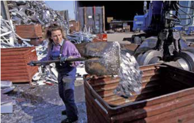
Abb. 9: In Wertstoffhöfen zeigt sich der Wert von Rohstoffen: Ausschussware wird gewinnbringend recycelt.