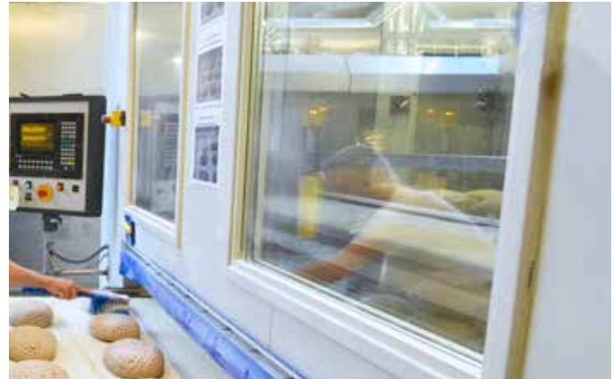
Abb. 8: Es lohnt sich, das Augenmerk vor allem auf den Bereich zu richten, wo die grössten Verbräuche entstehen, wie zum Beispiel auf den Energieverbrauch in Bäckereien.