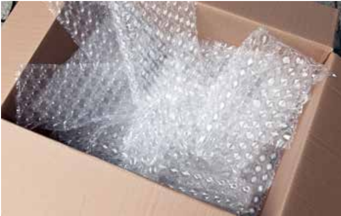
Abb. 12: Auch Verpackungsmaterial wird am besten sparsam eingesetzt, denn auch dessen Beschaffung und Entsorgung ist mit Kosten verbunden.