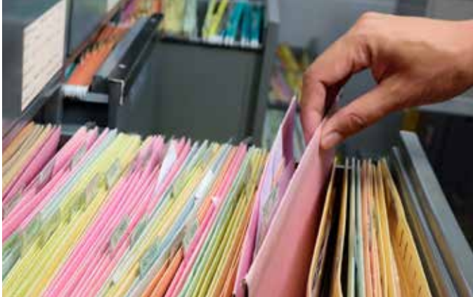
Abb. 14: Viele notwendigen Daten sind bereits in vorhandenen Unterlagen wie Rechnungen und Lieferscheinen enthalten. Um die Verbräuche einzelner Prozesse zu bestimmen, kann es aber auch sinnvoll sein, über eine bestimmte Zeit Messungen vorzunehmen.

Die wichtigsten Daten zum Berechnen der relativen Kennzahlen müssen nicht zwingend durch Messungen erhoben werden. Sie sind grösstenteils in bereits vorliegenden Unterlagen auffindbar, meist in Rechnungen von Versorgern, Zulieferern oder Entsorgern. In vielen Fällen stellen diese auf Anfrage auch weitere Daten zur Verfügung.