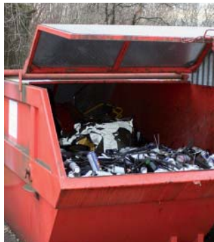
zwischengelagerte Abfälle in einer gedeckten Mulde

Auf öffentlichem und privatem Grund dürfen keine Abfälle im Freien abgelagert oder stehen gelassen werden. Dies gilt insbesondere für ausgediente Teile aus Metall oder Kunststoff. Abfälle sind entweder in gedeckten dichten Mulden oder unter Dach zwischengelagert. Abfälle, die mit wassergefährdenden Flüssigkeiten wie z.B. Öl oder Lösungsmittel verschmutzt sind, müssen in einer dichten, gedeckten Mulde oder in einem abflusslosen Raum gelagert werden.