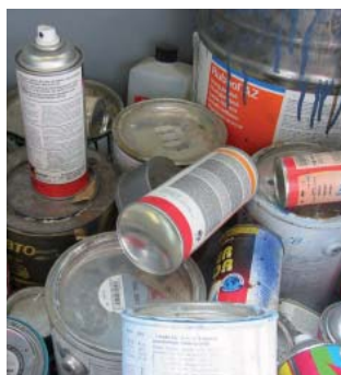
Sonderabfälle gehören nicht in den Kehrichtsack.

Bei Wartungsarbeiten fallen Sonderabfälle wie Altöle, Farbreste und -stäube etc. an. Schiffsbatterien, Reste von Farben oder Antifoulings können zur Entsorgung an die Verkaufsstelle zurückgebracht werden. Andere Sonderabfälle müssen aufgrund ihrer Zusammensetzung separat bei einem autorisierten Sonderabfallempfängerbetrieb entsorgt werden. Wir empfehlen, die entsprechenden Entsorgungsquittungen während mindestens fünf Jahren aufzubewahren. Ölhaltiges Bilgenwasser darf nur in dazu eingerichteten Häfen oder Bootswerften entsorgt werden.