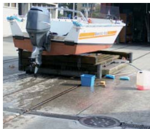
Waschplatz mit Anschluss an die Kläranlage

Abwässer aus Bootsreinigungen, Unterhaltsarbeiten etc. sind je nach Beschaffenheit vorzubehandeln und anschliessend in die öffentliche Schmutzwasserkanalisation einzuleiten. Das in die Kanalisation abfliessende Abwasser hat der eidgenössischen Gewässerschutzverordnung (GSchV) vom 28. Oktober 1998 zu entsprechen.