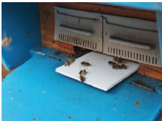
Schäfer-Diagnosefalle in Magazin Schweizer Kasten (links) und Bienenhaus (rechts)