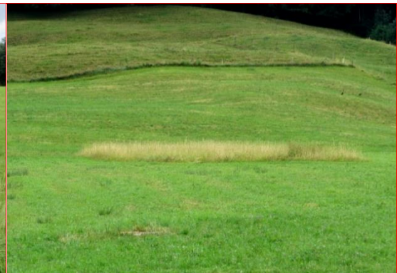
Zu wenig Fläche