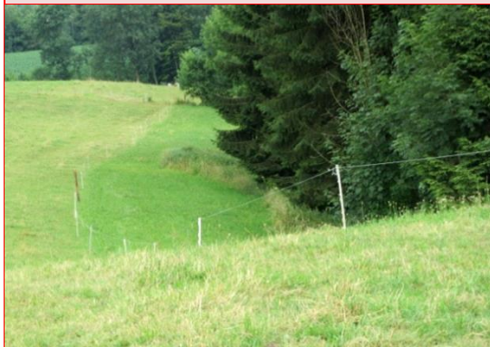
Zu wenig Fläche und sehr schattig