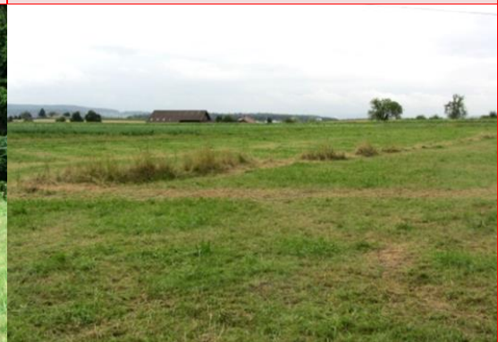
Zu wenig Fläche und zu schmal