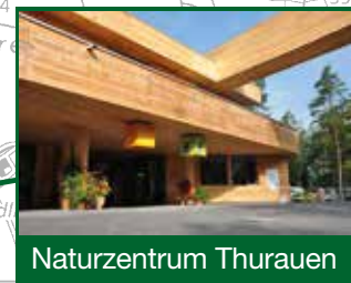
Naturzentrum Thurauen Naturzentrum bis Start/Ziel Erlebnisweg ca. 1,5 Stunden Fussmarsch.

Schutzverordnung Eggrank - Thurspitz vom 13. April 2011, mit Änderungen vom 18. April 2017 (ZH) Schutzverordnung Marthalen vom 19. Dezember 1991, mit Änderung vom 28. Februar 1992 (ZH) Schutzverordnung Eggrank - Thurspitz vom 23. Mai 2017 (SH)