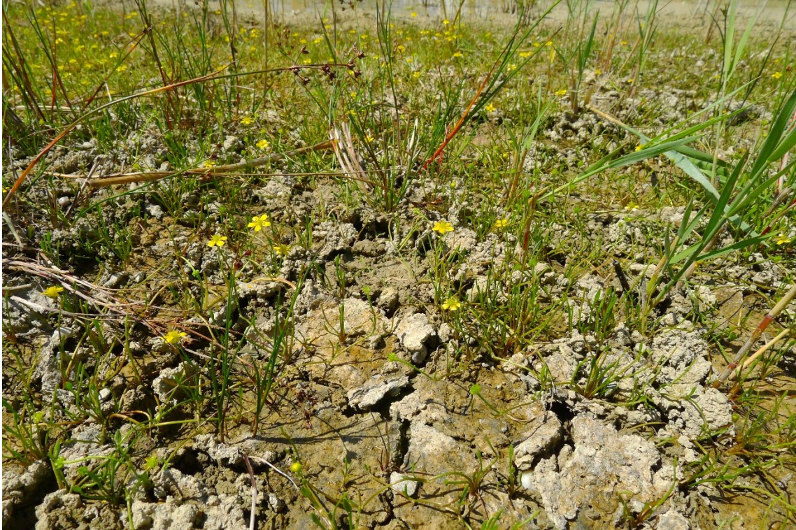
Abb. 3 Ranunculus reptans L. in einem geeigneten Sekundärbiotop auf sandig-lehmigem Boden mit hohem Feinanteil. Die Pflanzen besiedeln das zeitweise trockenfallende Ufer eines astatischen Teiches/Tümpels mit schwankendem Wasserstand in einer ehemaligen Kiesgrube.