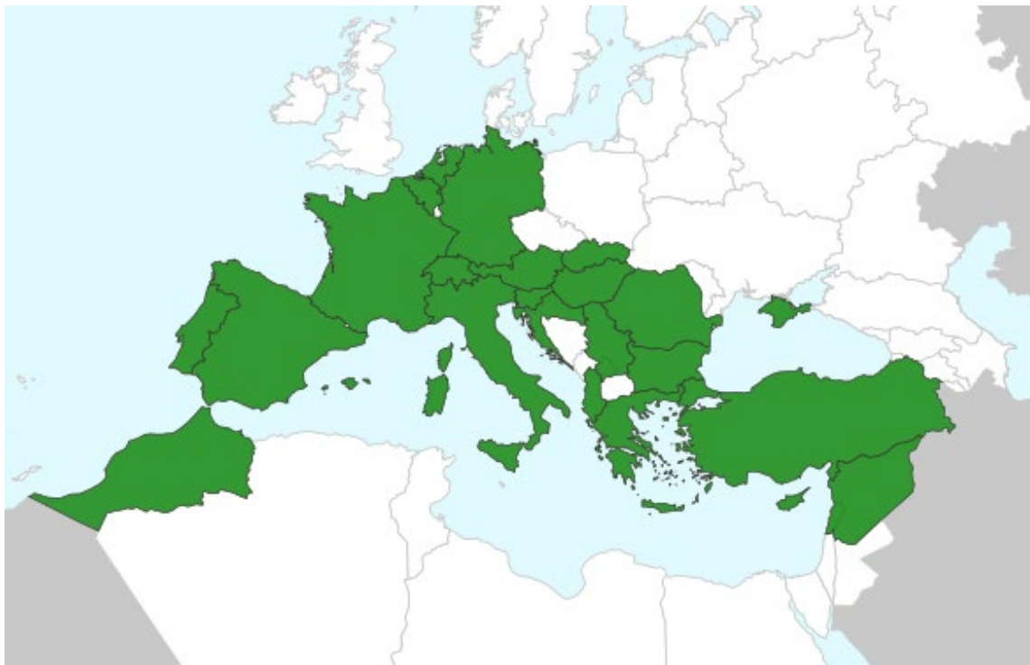
Abb. 1 Aktuelle Verbreitungssituation von Blackstonia acuminata (W. D. J. Koch & Ziz) Domin. in Europa. Anmerkung: Die Karte gibt die Vorkommen auf Basis der Ländergrenzen an, was jedoch keine Rückschlüsse auf die tatsächliche Arealgrösse und die Fundhäufigkeiten zulässt.

(EN) (Rote Liste Zentrum, 2023) und in Österreich ist er vom Aussterben bedroht (CR) (Schratt-Ehrendorfer et al., 2022). Im Rahmen der Berechnung der neuen Artwerte für die Fachstelle Naturschutz ergab die Einschätzung der Gefährdung der Pflanzenarten in Europa durch S. Demuth und Th. Breunig (Marti, 2020) für Blackstonia acuminata die Einstufung «potenziell gefährdet».