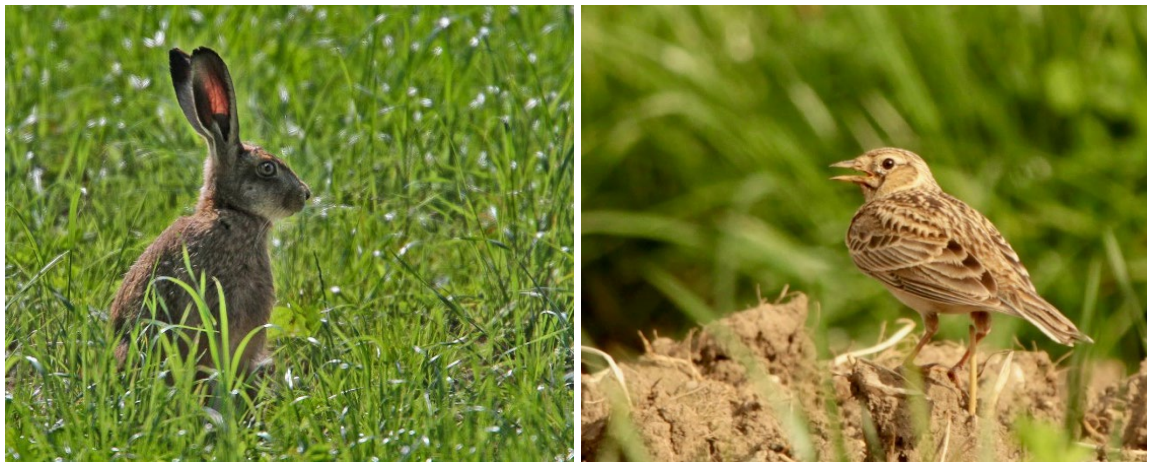
Abb. 1: Feldhase: Klaus Robin, Feldlerche: Feldlerchenprojekt Weinland

Feldhase und Feldlerche sind typische Arten der Ackerbaugebiete. Ihre Bestände haben in den letzten Jahren stark abgenommen. Mit der Fördermassnahme «Getreide in weiter Reihe» sollen Brut- und Rückzugsräume entstehen und eine Nahrungsgrundlage geschaffen werden.