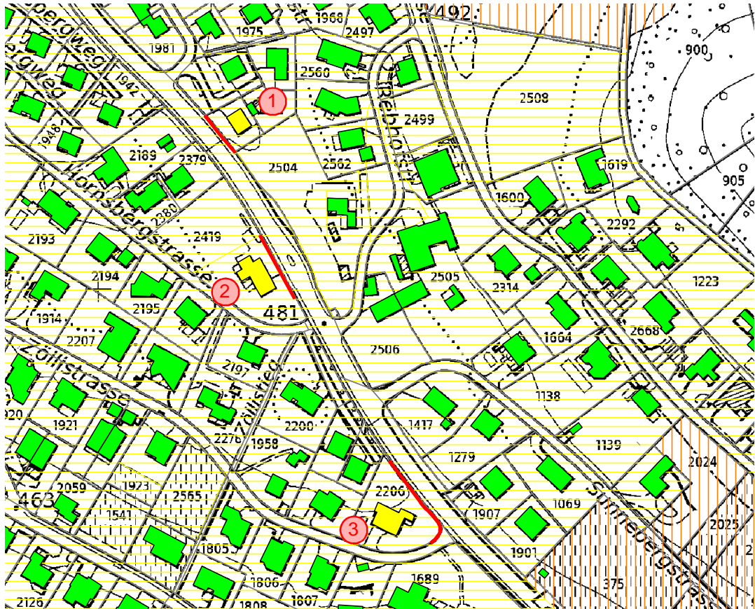
Abb 1 Auszug aus Lärmbelastungskataster (GIS-LBK) Beurteilungszustand 2035