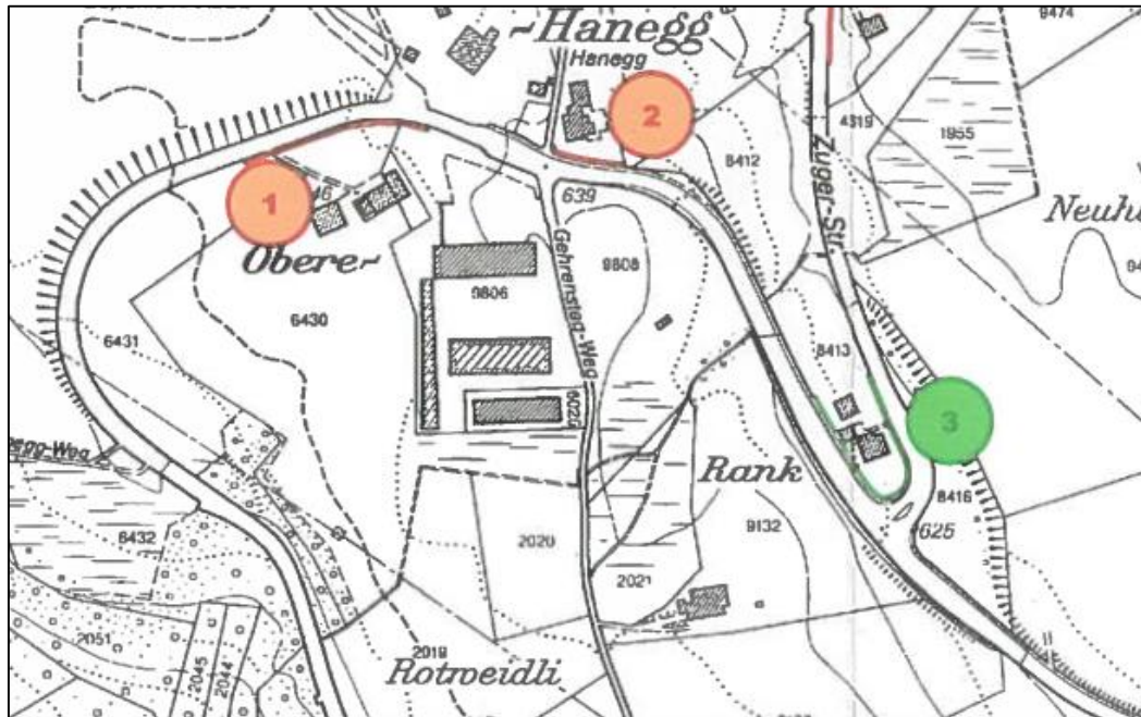
Abb 1 Auszug aus Beurteilungsplan Machbarkeit von baulichen Massnahmen