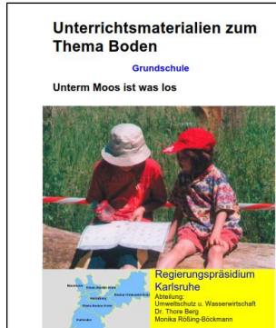
Bild: Unterrichtsmaterialien zum Thema Boden - Grundschule (lubw.de)

https://www.phbern.ch/dienstleistungen/unterrichtsmaterialien/ideenset-boden