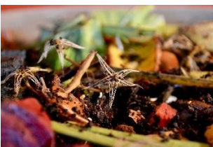
Bild: Worm-Up - Wurmkompost

https://www.demeter.de/bodenconnectionentdecken#nahrhaft