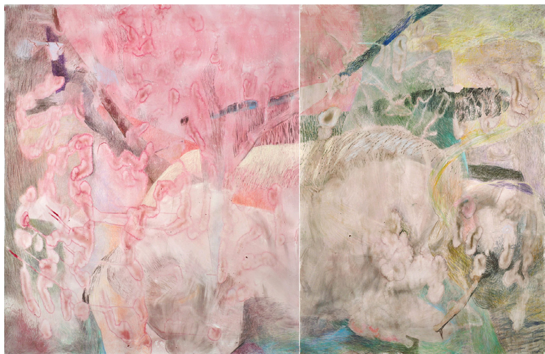
Bugs (EINSILBIGE TIERE), 2020. Wasserfarbe, Kohle, Pastellkreide auf Papier, zwei Teile, gesamt 178 x 275 cm