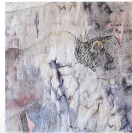
simulierte Hängung: „M“ aus der Werkgruppe HAPPY KNOWLEDGE, 2022. Wasserfarbe, Kohle, Pastellkreide auf Papier, drei Teile, je ca. 153 x 150 cm