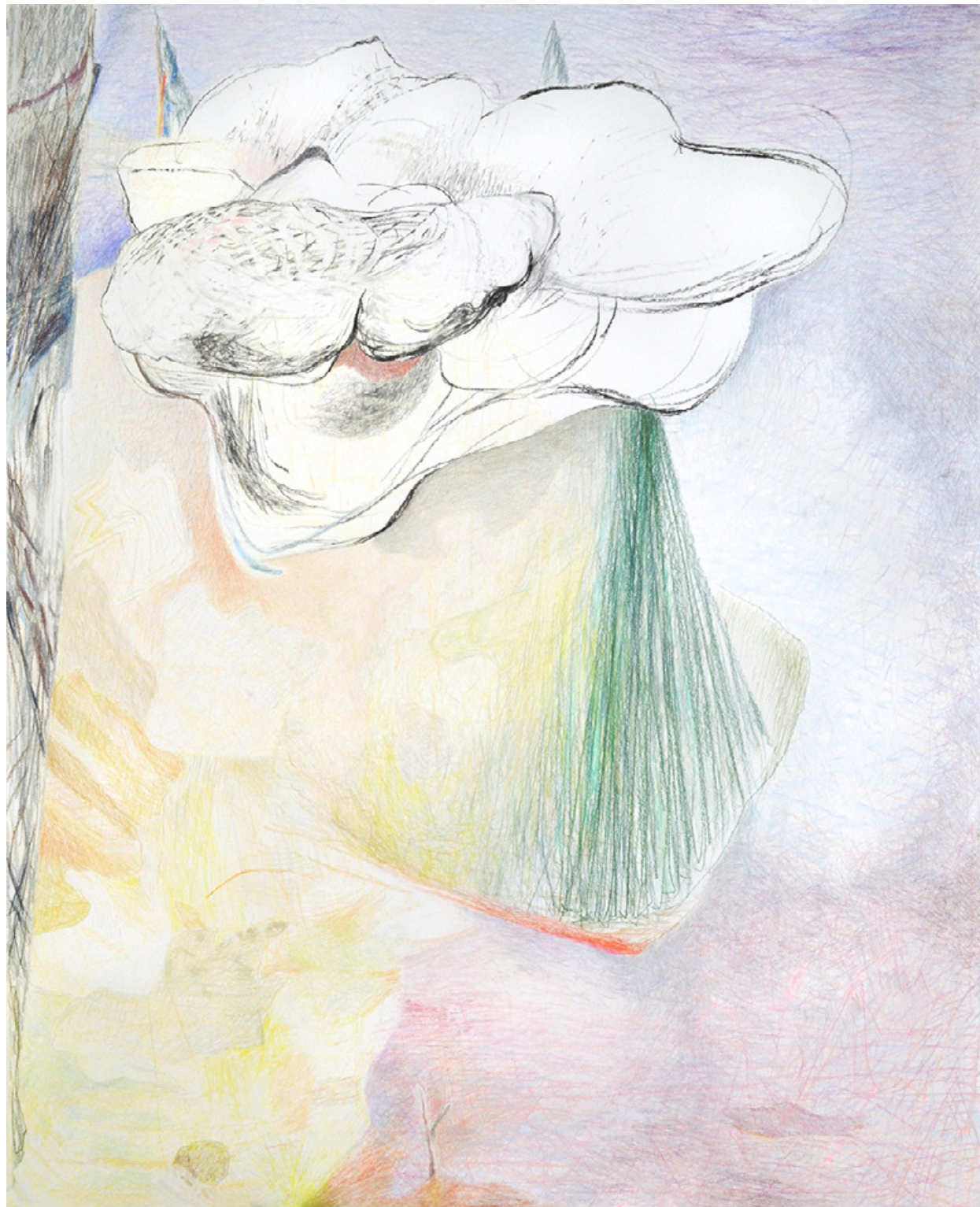
Kuh (EINSILBIGE TIERE) 2020 Kohle, Pastellkreide/Papier, 150 x 122 cm