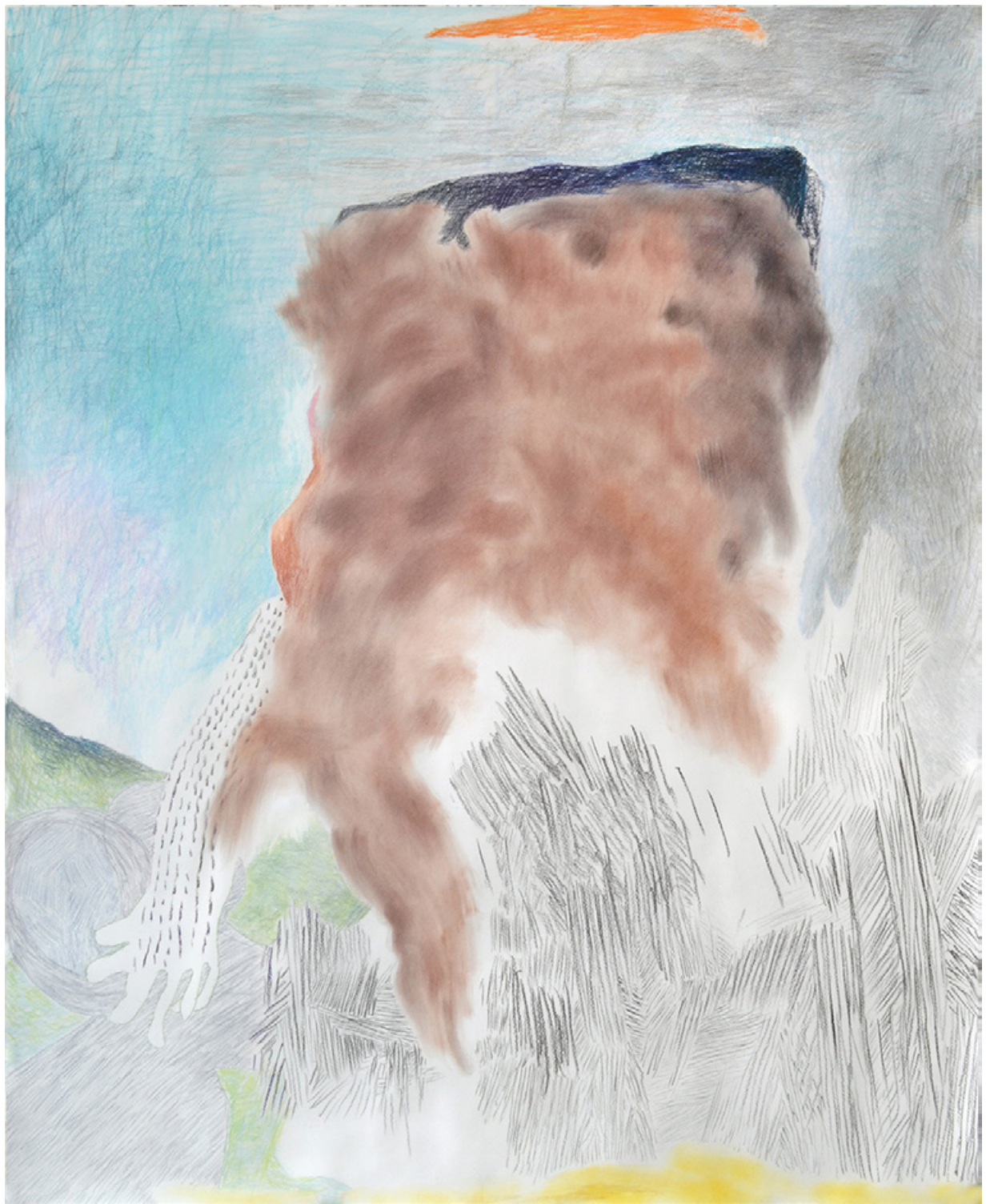
Maus (EINSILBIGE TIERE) , 2021 Pastellkreide und Kohle auf Papier, 150 x 122 cm