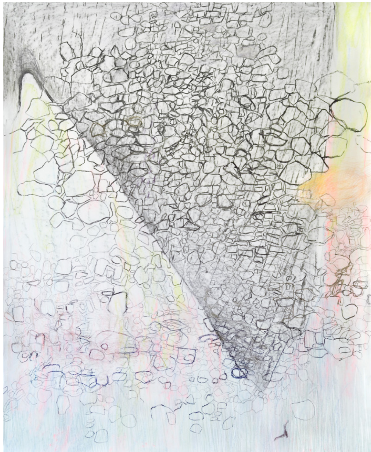
Achsel (ANTI-FALTEN), 2019 Kohle, Pastellkreide/Papier, 150 x 122 cm