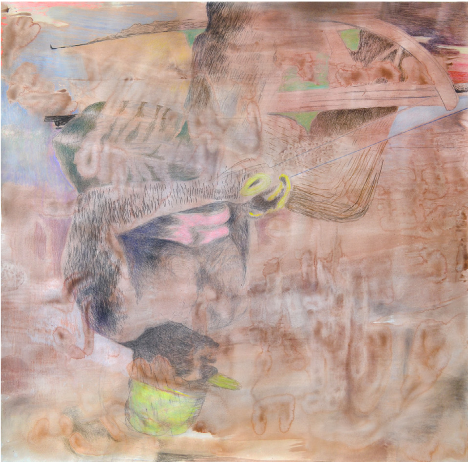
M 01 (HAPPY KNOWLEDGE), 2022 Wasserfarbe, Kohle, Pastellkreide auf Papier, ca. 150 x 153 cm