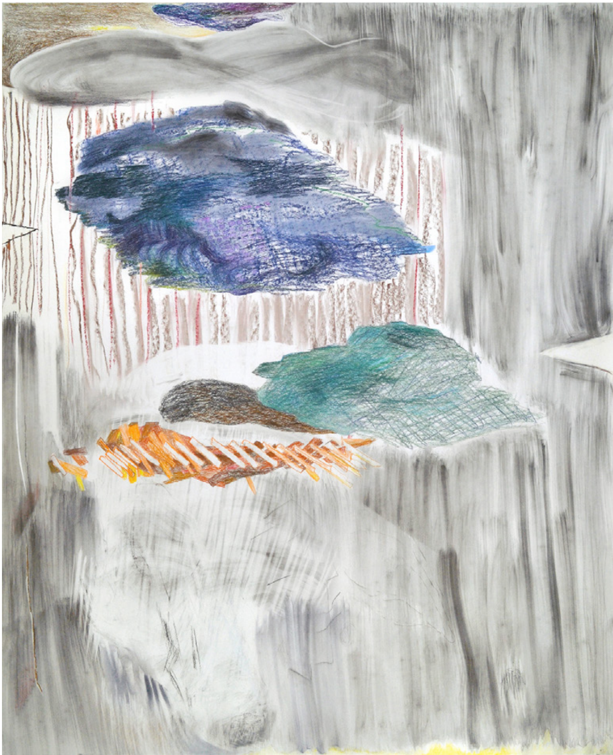
Wolf (EINSILBIGE TIERE), 2020 Kohle, Pastellkreide/Papier, 150 x 122 cm