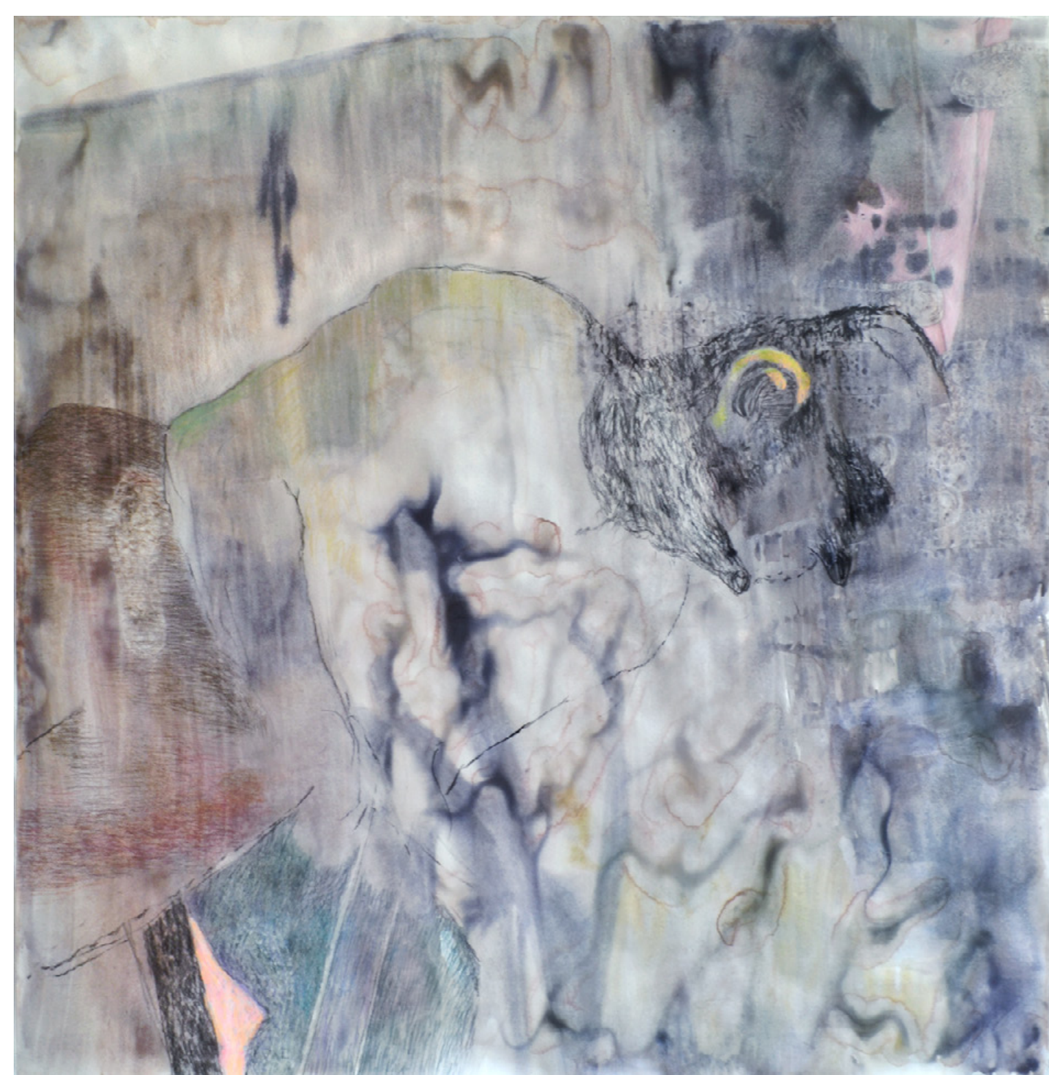
M 02 (HAPPY KNOWLEDGE), 2022 Wasserfarbe, Kohle, Pastellkreide auf Papier, ca. 153 x 150 cm