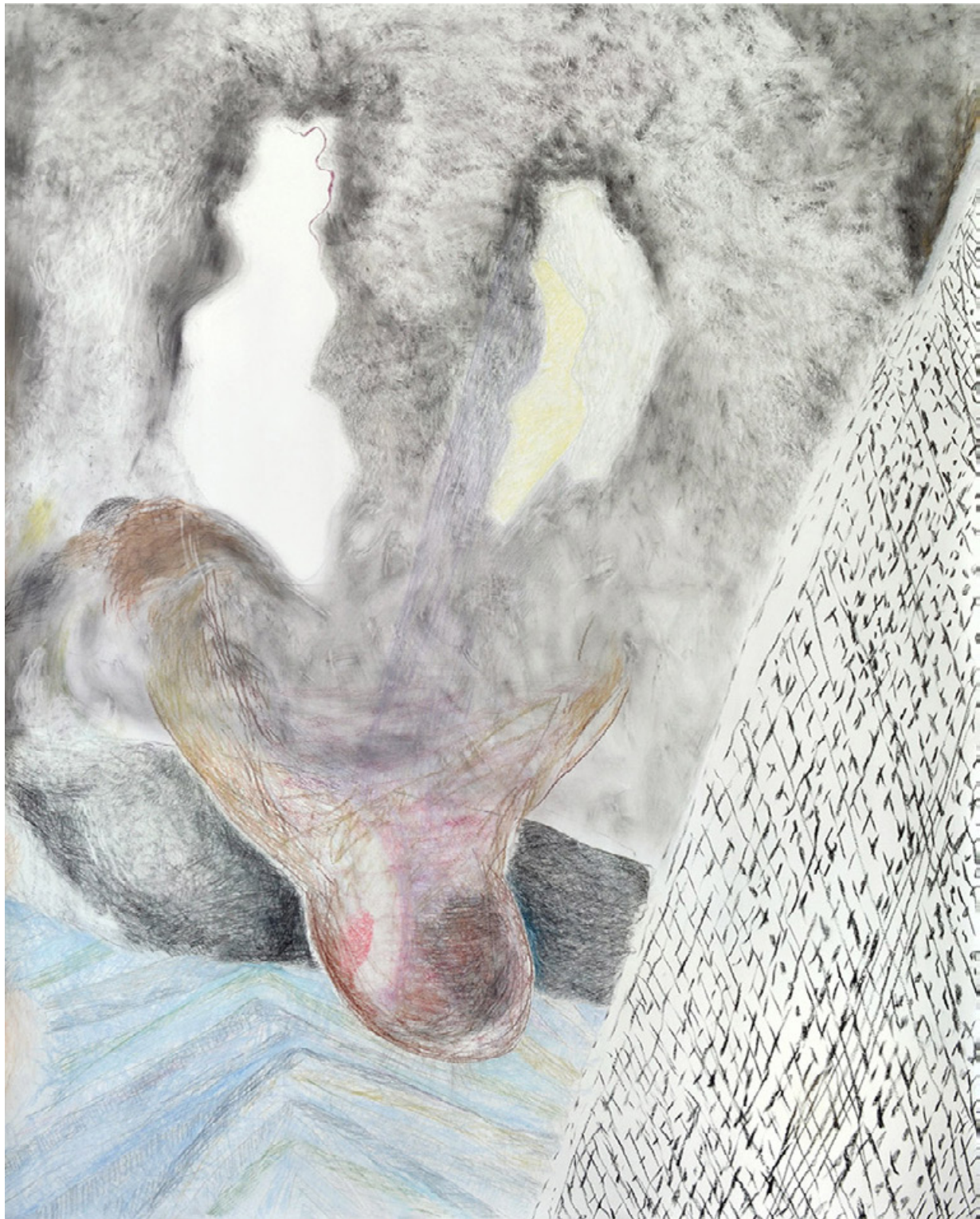
Nerz (EINSILBIGE TIERE), 2020.

Kohle, Pastellkreide auf Papier, 150 x 122 cm