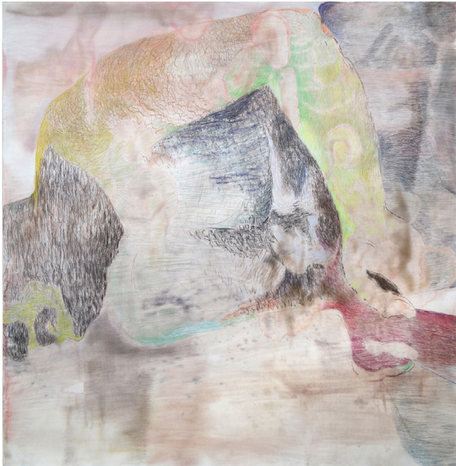
M 03 (HAPPY KNOWLEDGE), 2022 Wasserfarbe, Kohle, Pastellkreide auf Papier, ca. 153 x 150 cm