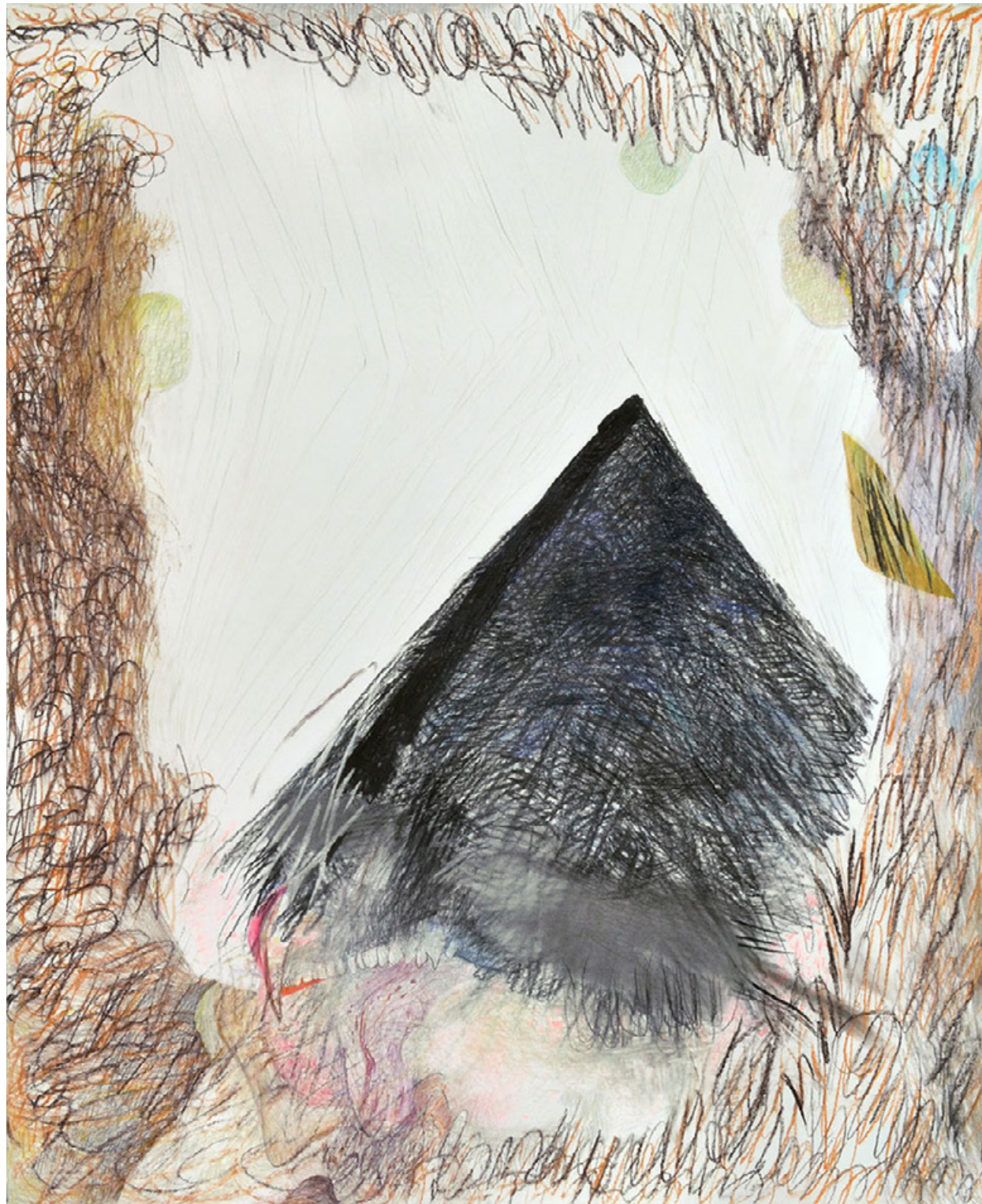
Luchs (EINSILBIGE TIERE) 2020 Kohle, Pastellkreide/Papier, 150 x 122 cm