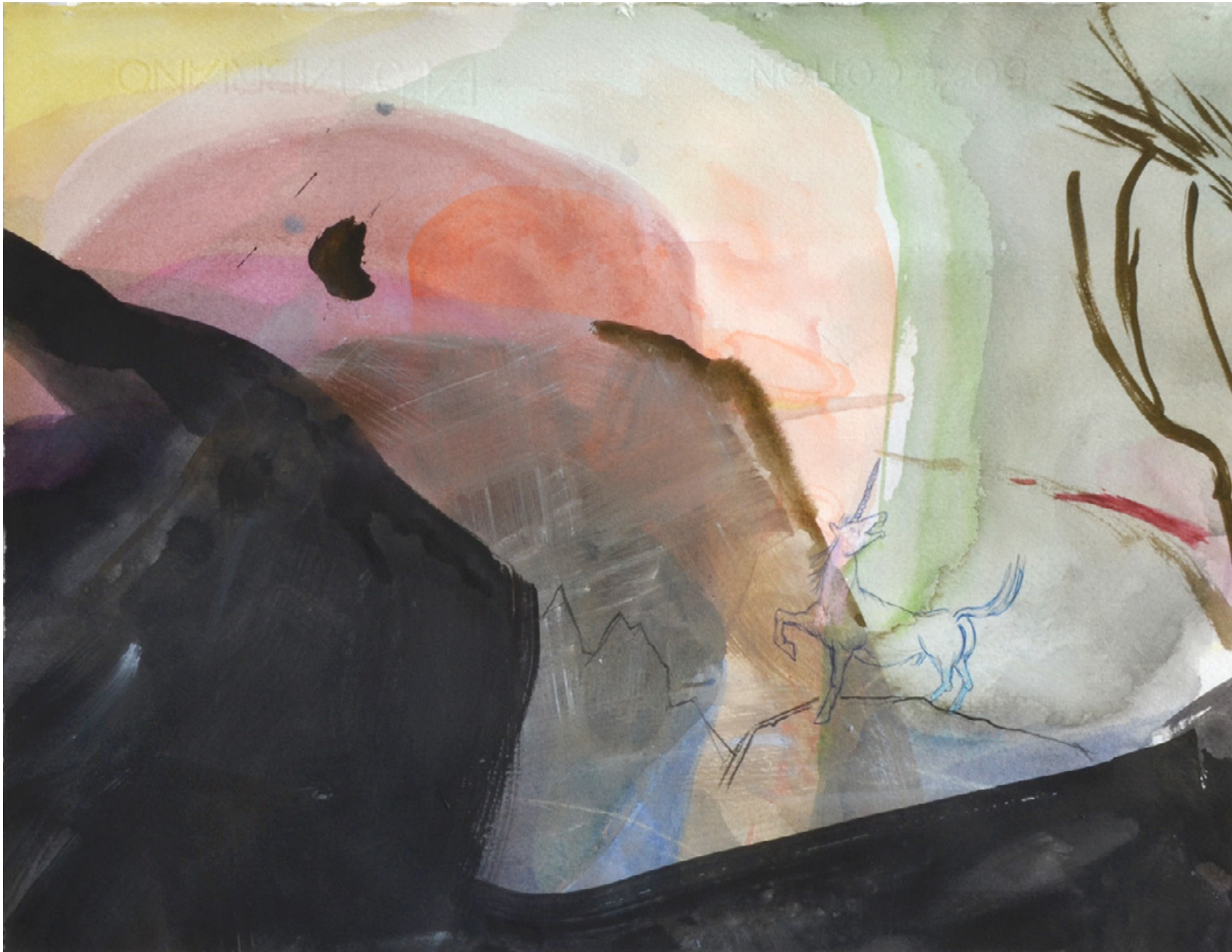
Horn, 2021 Mischtechnik auf Papier, 30 x 38 cm