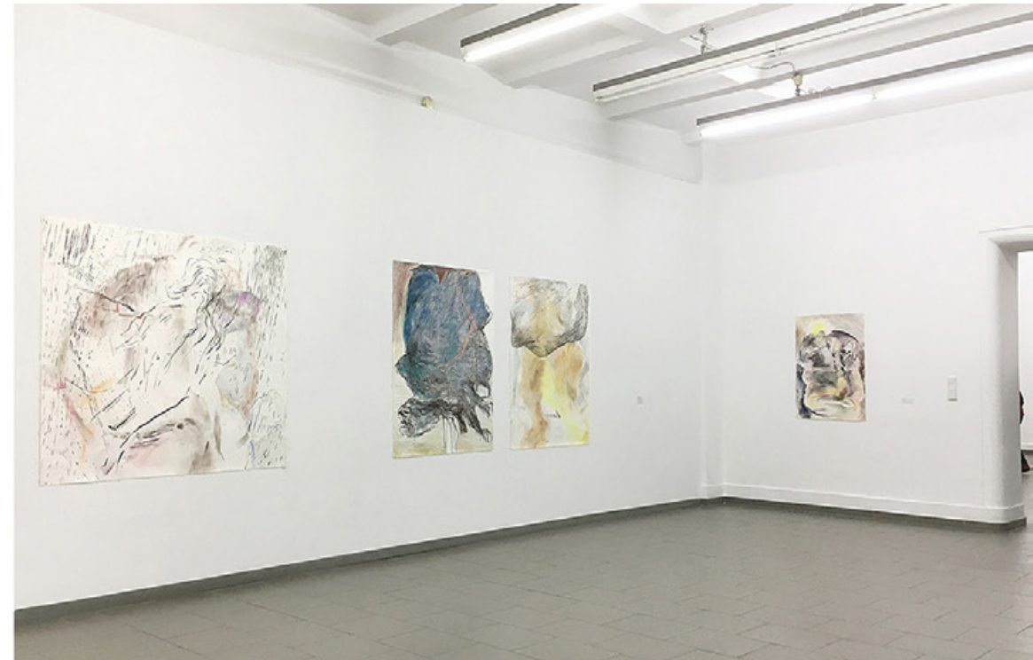
Ausstellungsansichten "Palmenschatten", Haus am Kleistpark Berlin, 2022 Meisenmann Remix (KAUNTRI), 2020, ca. 188x480 cm, Grosse Darmlandschaft, 2007, 150x217 cm