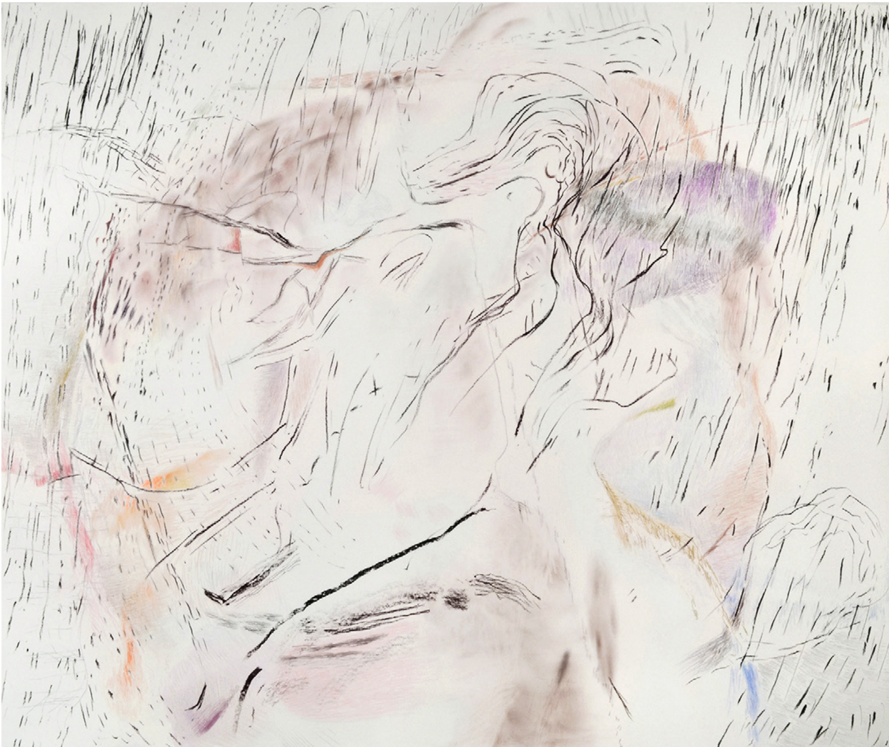
Verschwinden 2018-2020 Pastellkreide, Kohle auf Papier, 150 x 178 cm