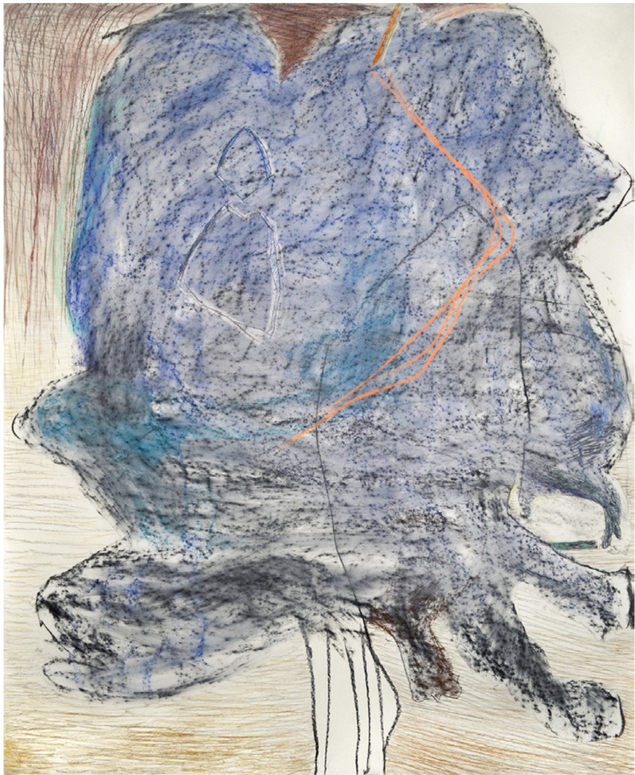
Ohne Titel, 2019-2020 Pastellkreide, Kohle auf Papier, 150 x 122 cm