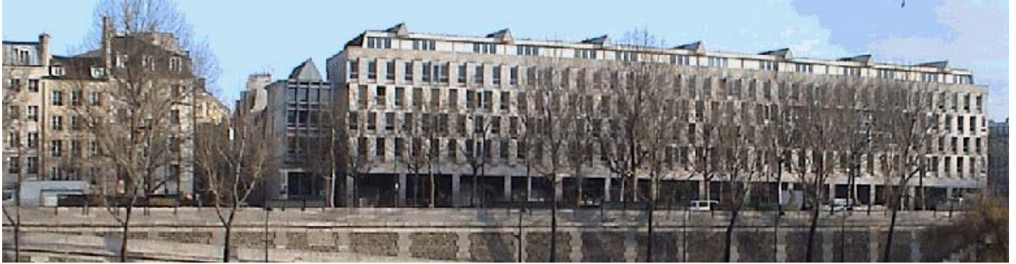
Die Cité Internationale des Arts in Paris