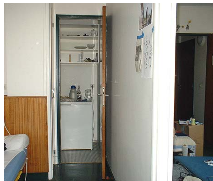
Schlafecke, im Hintergrund die Küche

Das Atelier ist mit allem Notwendigen ausgestattet und verfügt über einen Festnetz-Telefonanschluss.