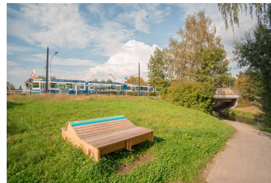
Temporäre Sitzgelegenheiten und Liegen aus Holz wurden 2018 als Vorboden für den Fil Bleu aufgestellt.

Die in einen eintönigen Kanal gezwängte Glatt wird heute allerdings kaum als «schön» empfunden: Eine lebendige, naturnahe Flusslandschaft sieht anders aus. Christian Marti, Abteilungsleiter Wasserbau im AWEL, beschreibt die Lebensader des Glattals als «wenig attraktives, träges, stark begradigtes Gewässer». Solche wasserbaulichen Sünden aus der Zeit der Industrialisierung will man heute nach Möglichkeit wieder rückgängig machen. Nicht nur an der Glatt, sondern schweizweit. Ein Sinneswandel, so erzählt Marti, der durch die Hochwasser im Jahr 1987 eingeläutet worden sei: «Damals zeigte sich, dass der klassische Hochwasserschutz an seine Grenzen stösst.» Als einer der ersten Kantone lancierte der Kanton Zürich in den 1990er-Jahren auch aus