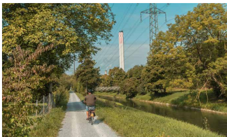
An der Glatt hat es heute feste Uferverbauungen aus Steinblöcken.

Der etappenweise Ausbau dieses Uferwegs ist eine der zentralen Massnahmen im Freiraumkonzept «Fil Bleu Glatt». Der bestehende Weg ist schmal und nicht überall durchgehend. «Das macht dieses Projekt auch für uns einzigartig. Wir haben im Kanton noch nie einen Fuss- oder Radweg in dieser