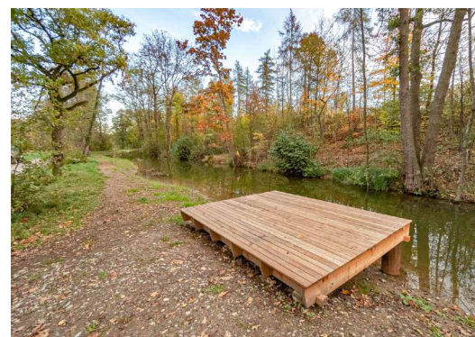
Plattformen wie dieses Muster in Dübendorf gewähren einen attraktiven Zugang zum Wasser.

Das Freiraumkonzept «Fil Bleu Glatt» wird in einzelnen Etappen realisiert. Diese sind unter anderem abhängig vom Projektstand und der Budgetplanung in den einzelnen Städten und Gemeinden, wo teilweise die Parlamente oder Gemeindeversammlungen noch grünes Licht geben müssen. Bis zum voraussichtlichen Projektabschluss im Jahr 2031 wird also noch viel Wasser durch das Glattal in den Rhein fließen – dann aber vielleicht durch ein attraktives Naherholungsgebiet und eine lebendigere, naturnahe Glatt.