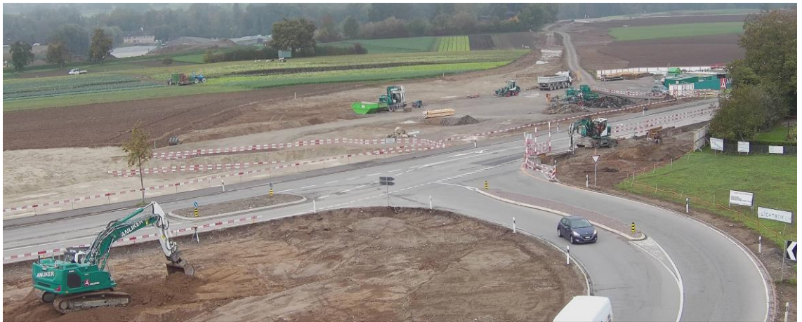
Die Bauarbeiten für den Kreisel an der Affolternstrasse laufen auf Hochtouren.

Seit dem Spatenstich im August wurde nur auf der grünen Wiese gearbeitet. Nun betreffen die Bauarbeiten auch die Verkehrsachse zwischen Obfelden und Ottenbach. Als erstes wird der neue Kreisel an der Affolternstrasse realisiert. Um den Verkehrsfluss möglichst nicht zu beeinträchtigen, ist seit dem 5. Oktober 2020 eine provisorische Umfahringstrasse im Bau.