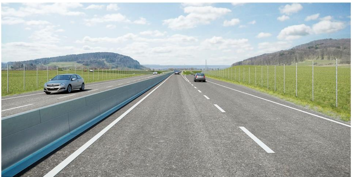
Zwischen Bülach-Nord und dem Kreisel Chrüzstrass wird die Schaffhauserstrasse auf vier Spuren ausgebaut.

Mehr Informationen finden Sie unter www.zh.ch/strassenbaustellen , Rubrik «Bülach/Glattfelden»