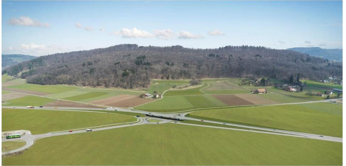
Ausbau des Kreisels Chrüzstrass.