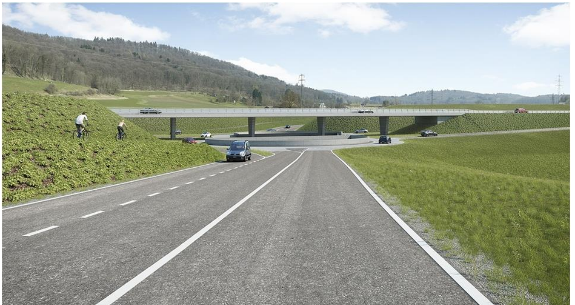
Der zukünftige Kreisel Chrüzstrass von Glattfelden aus gesehen.