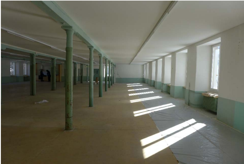
Ehem. Fabrikraum vor Ausführung der Malerarbeiten (P1310050)