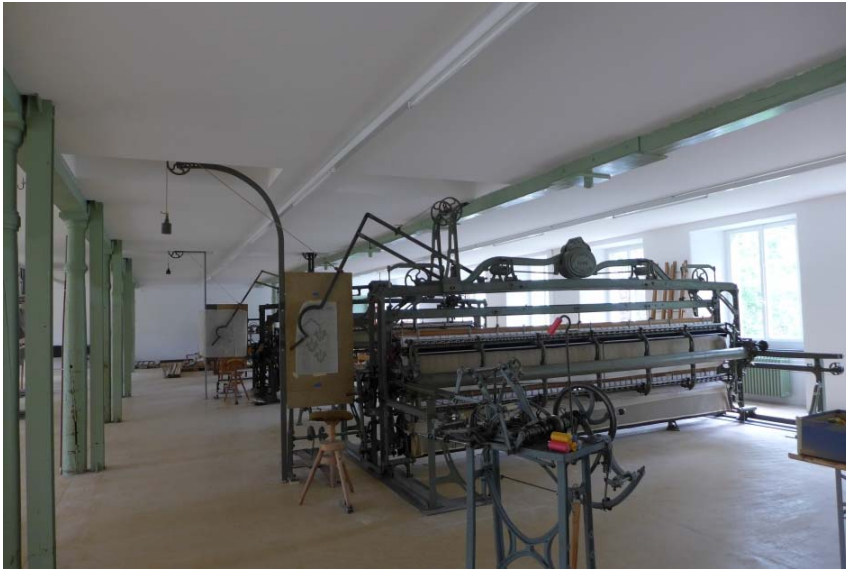
Decke mit Aussparungen (P1040929)