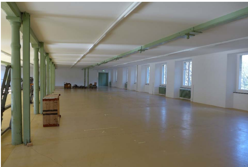
Ehem. Fabrikraum nach Ausführung der Malerarbeiten (P1310319)

Nach Erstellung der Deckenaussparungen wurden die neuen Verkleidungen gespachtelt und gestrichen. Der Farbton der Aussparungen wurde an den bestehenden Farbton der Decke angepasst.