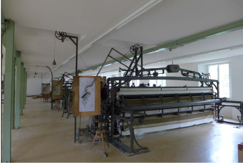
Decke mit Aussparungen (P1040934)