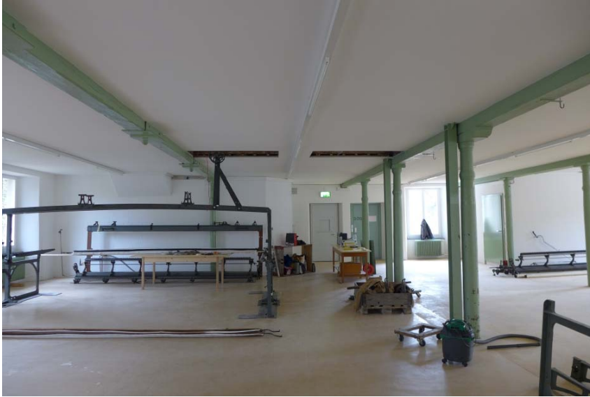
Lagebestimmung der der Aussparungen (P1310604)