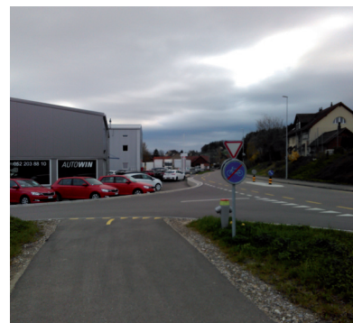
Ortseinang West: Veloführung Richtung Ortsmitte