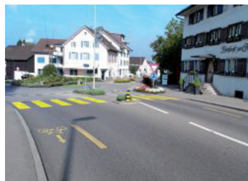
Radstreifen beginnen unmittelbar nach dem Kreisel