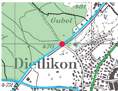
Lokalisierung, 1:25'000, Nebenverbindung