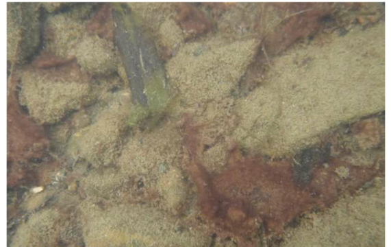
Abb 8 b: Zürich-Obersee August 2021; Algenaufwuchs auf Steinen mit rötlich gefärbten «Krötenhäuten» von Tychonema bourrellyi .