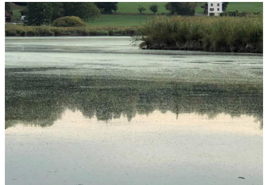
Abb 3a und b: Lützelsee 28.8.2018; Aphanizonemon flos-aquae