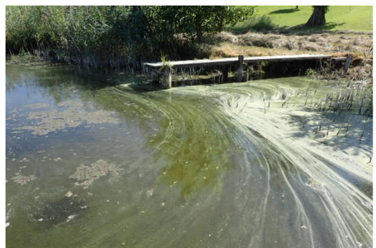
Abb 5a und b: Hüttnersee 27.8.2021 und 6.9.2021; Microcystis aeruginosa