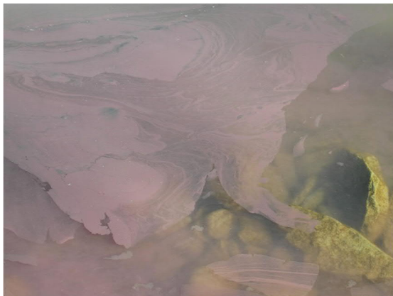
Abb. 6: Oberflächenfilm am Ufer des Zürichsees.

In einem schönen Sommer mit stabilem Wetter befinden sich die Burgunderblutalgen in einer Tiefe von 8 bis 15 Metern und damit in sicherer Distanz zu Badegästen. Als Folge wechselhaften Wetters traten 2020 aber bereits im September erste Ansammlungen von Planktothrix rubescens an der Seeoberfläche auf – noch während der Badesaison.