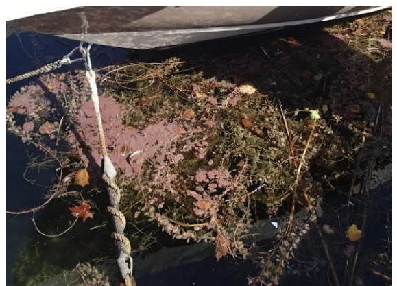
Abb. 7: Zürichsee 11.9.2020; Burgunderblutalgen vermischt mit Wasserpflanzen zwischen Booten