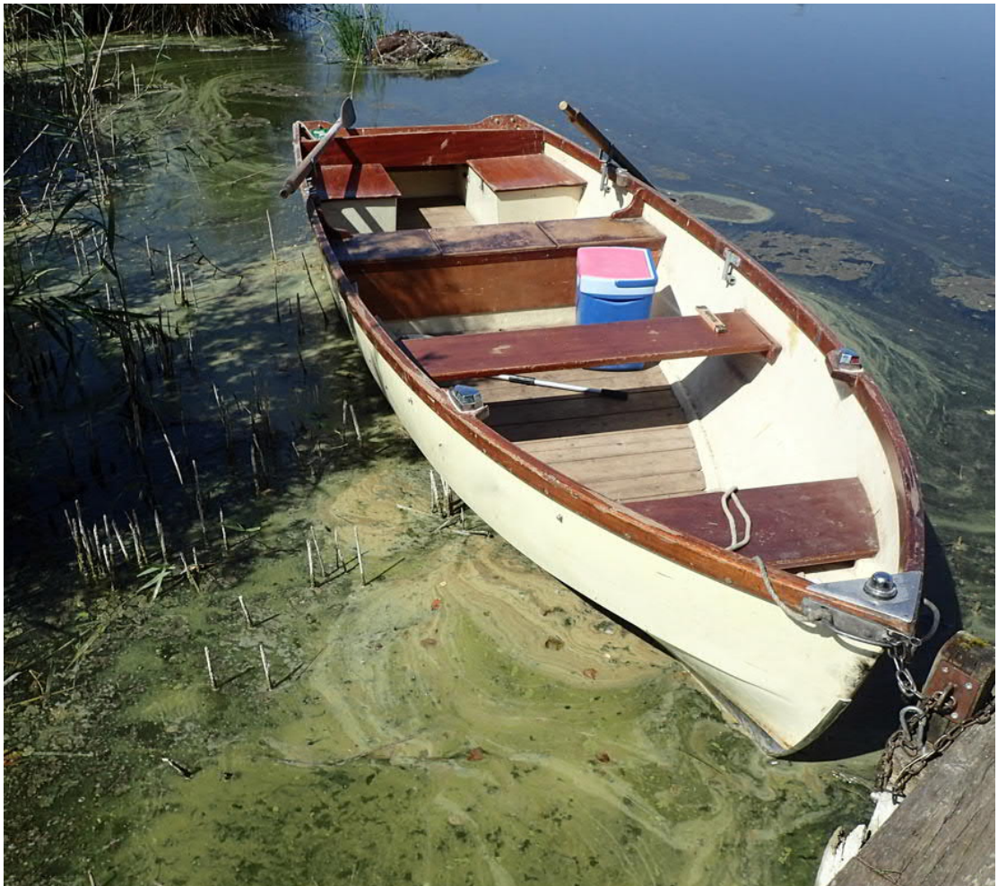
Abb. 1: Ansammlung von Blaualgen am Ufer des Hüttnersees im Sommer 2021.

Es gibt mehrere tausend Arten von Blaualgen auf der Erde, die man in ganz unterschiedlichen Lebensräumen im Wasser und an Land findet. In unseren Seen und Fliessgewässern kommen Blaualgen das ganze Jahr über weit verbreitet vor. Einige Arten enthalten neben grünen Pigmenten blaues Phycocyanin. Sie sind daher blau-grün gefärbt, was die Namensgebung begründet. Die Bezeichnung Blaualgen gilt aber für alle Cyanobakterien, auch für die Arten, die kein Phycocyanin haben und gelb, grün, braun oder sogar rot gefärbt sein können. Einige Arten können Stoffwechselprodukte bilden, die für Mensch und Tier giftig sind. Bei Massenvorkommen von Blaualgen ist daher Vorsicht geboten.