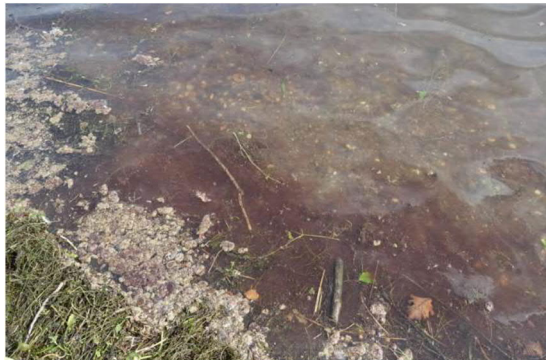
Abb 8 a: Zürich-Obersee August 2021; rötlich gefärbte Ansammlungen von Tychonema bourrellyi .

Grundsätzlich sind Blaualgen in artenreicher Zusammensetzung als Aufwuchsalgen im Uferbereich unserer Seen weit verbreitet. Auffällige Massenentwicklungen sind selten. Ein gehäuftes Vorkommen kann bei Ansammlungen am Ufer kritisch sein, weil bereits das Verschlucken von geringen Mengen für Hunde und Kleinkinder gefährlich ist.