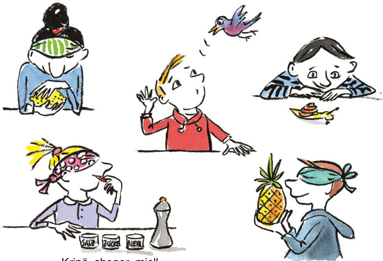
Kripë sheqer miell