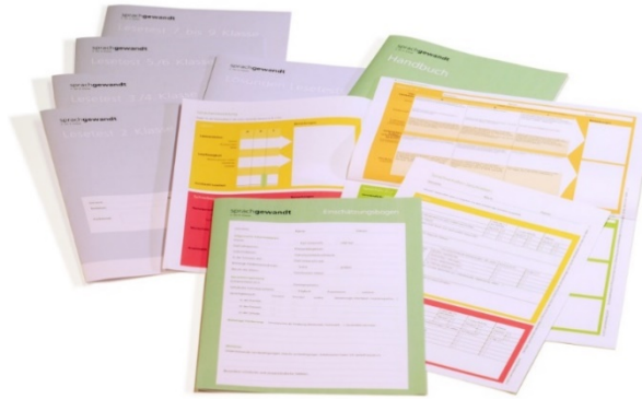
Abbildung 2: «Sprachgewandt» für 2. bis 9. Klasse