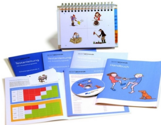
Abbildung 1: «Sprachgewandt» für Kindergarten und 1. Klasse

Test-Set, bestehend aus einem Testinstrument, einem Handbuch, einem Buch «Kompetenzraster und Beobachtungsbögen» mit Erläuterungen, Geschichten-Kärtchen, einem Einschätzungsbogen «Fortschritte Sprache», einer Testanleitung für drei Niveaus (Schwierigkeitsstufen) sowie einer Audio-CD. Nähere Informationen über den Einsatz einzelner Elemente finden sich in den Kapiteln 3 und 4 im Handbuch.