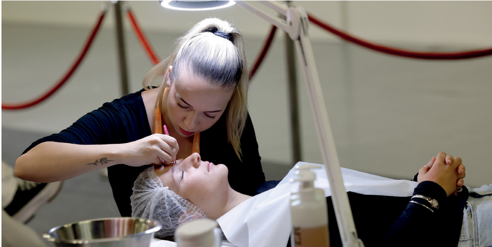
Lernende «Kosmetiker/in EFZ»

Von der Beitragspflicht befreit sind Betriebe, die Lernende ausbilden, einem Branchenfonds angeschlossen sind, einem Lehrbetriebsverbund angehören oder eine Lohnsumme von weniger als 250 000 Franken ausweisen.