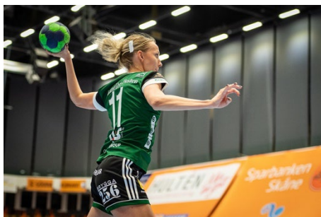
Handball: Pixabay / BorgMattisson