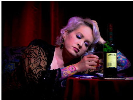
Ausgang und Alkohol