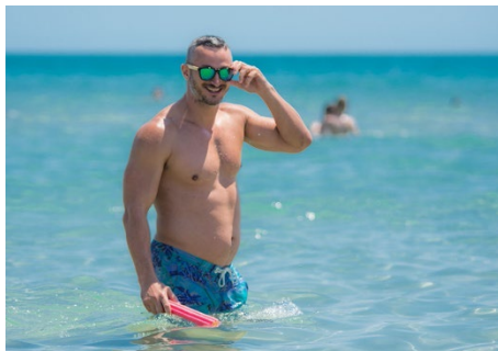
Meer: Pixabay / Anestiev