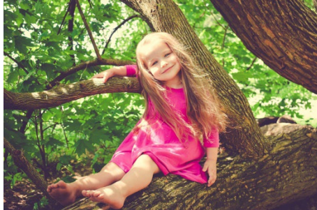
Kind: Pixabay / alteredeago