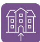
Zugang zu Gebäuden