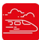
Zugang zum öffentli. Verkehr