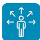
Zugang zu Dienstleistungen

Gemeinsam mit Ihnen und Ihren Abteilungsleitungen führen wir einen Workshop durch. Es werden die Grundlagen der Behindertenrechtskonvention vermittelt und von den Erfahrungen aus anderen Gemeinden berichtet. Mit Blick auf die spezifischen Bedürfnisse der Gemeinde werden Hilfsmittel für die BRK-Umsetzung vorgestellt.