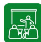
Zugang zu Informationen