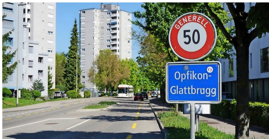
In Dägerlen ist die Demokratie breit abgestützt: 36,3 Prozent der Bevölkerung machten bei den letzten Wahlen mit. In Opfikon waren es nur 9,1 Prozent.