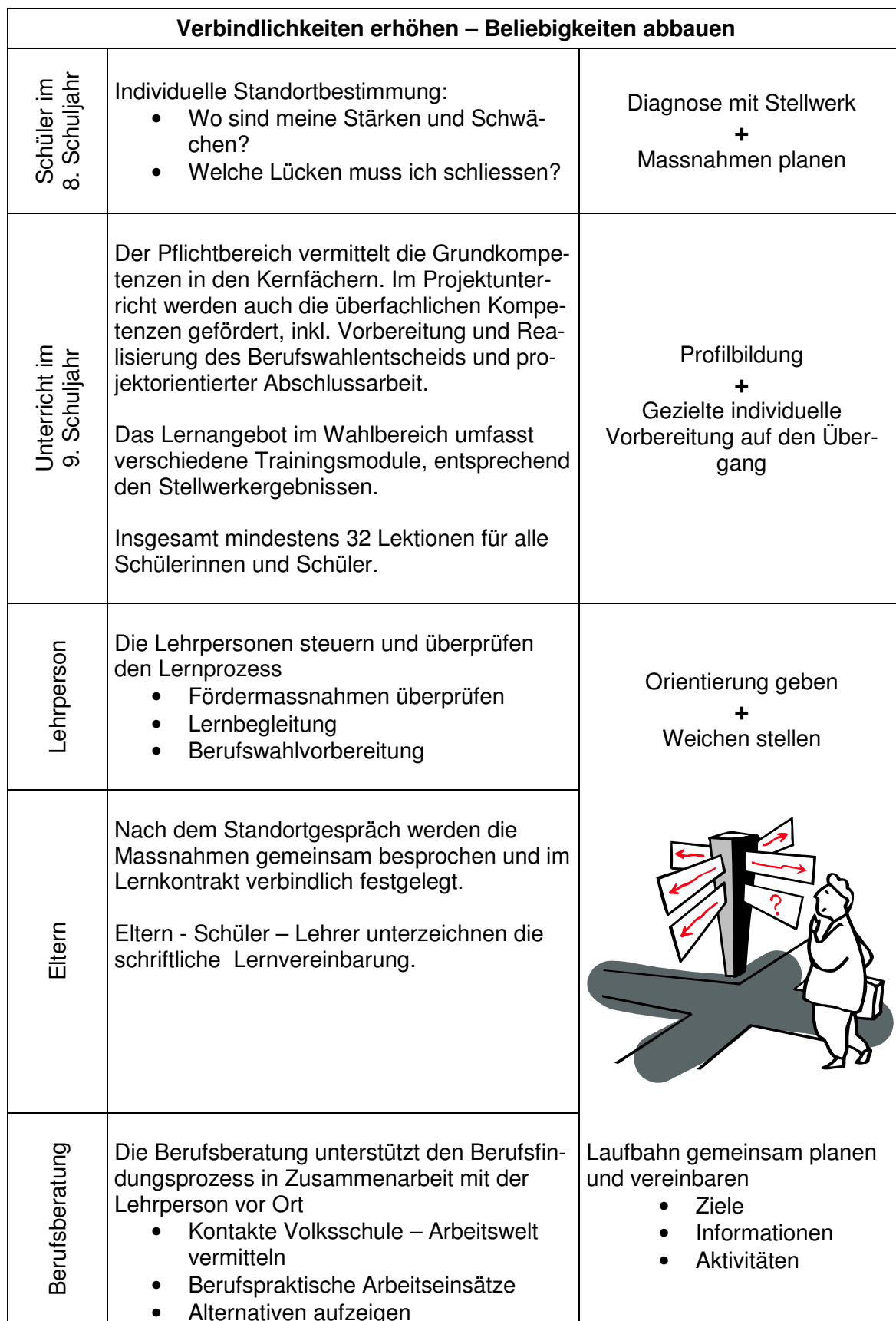
Tabelle 3: Übersicht