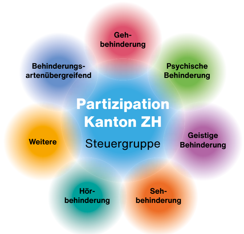
Abb. 1: Zürcher Mitwirkungsmodell «Partizipation Kanton Zürich»

Ein Entwurf dieses Aktionsplans wurde «Partizipation Kanton Zürich» zur Stellungnahme zugesandt. Bei einem Austausch mit den Direktionen konnten die Betroffenen ihre Anliegen vortragen. Gestützt darauf wurde der Aktionsplan finalisiert.