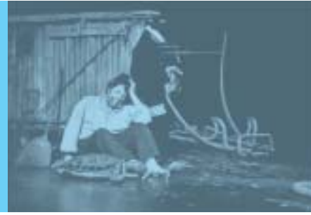
Casinotheater Winterthur: Spielszenen aus «Das Comeback der Geschwister Schmid»