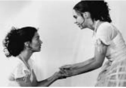
Theater Kanton Zürich: Spielszenen aus «Wie es euch gefällt»