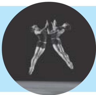
Opernhaus Zürich: Szene aus dem Ballett «In den Winden im Nichts»