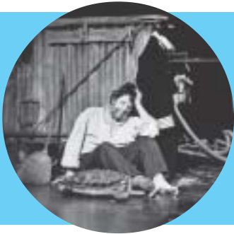
Freie Theatergruppen: Spielszene aus «Alplantis» von Peter Rinderknecht