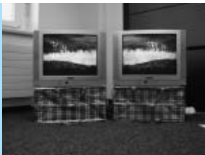
Bildende Kunst: Installation von Bessie Nager