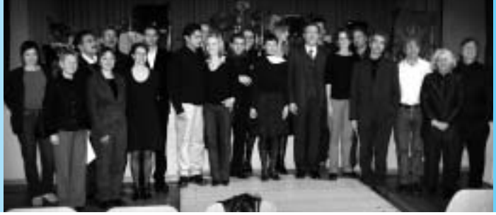
Kulturelle Auszeichnungen: Gruppenbild