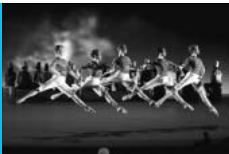
Opernhaus Zürich: Szene aus der Oper «Les indes galantes»