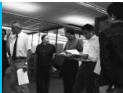
Bildende Kunst: Mitglieder der Arbeitsgruppe bei der Jurierung