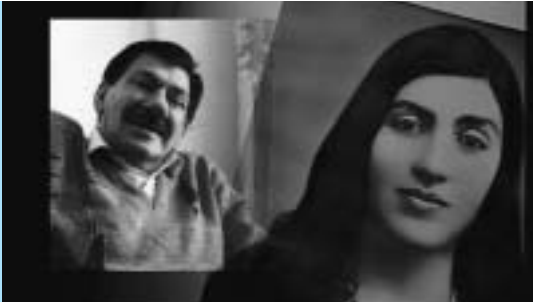
Freies Filmschaffen: Szenenbild aus «Forget Bagdad» von Samir