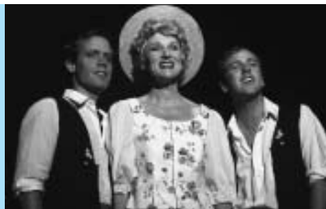
Casinotheater Winterthur: Spielszenen aus «Das Comeback der Geschwister Schmid»