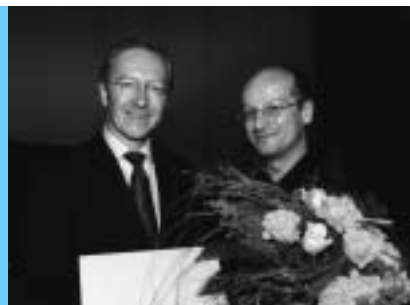
Internationale Bodenseekonferenz: Staatsminister Werner Schnappauf und Peter Färber