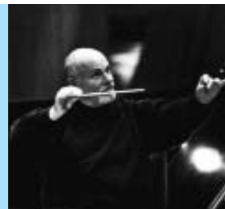
Tonhalle-Orchester: David Zinnmann