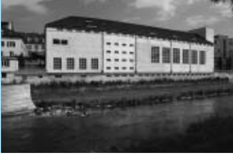
Haus Konstruktiv: Aussenansicht