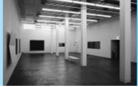
Haus Konstruktiv: Innenraum