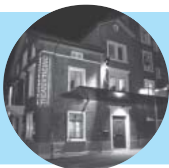
Theater Ticino Wädenswil: Aussenansicht