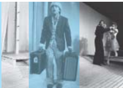
Theater Kanton Zürich: Spielszenen aus «Wie es euch gefällt»