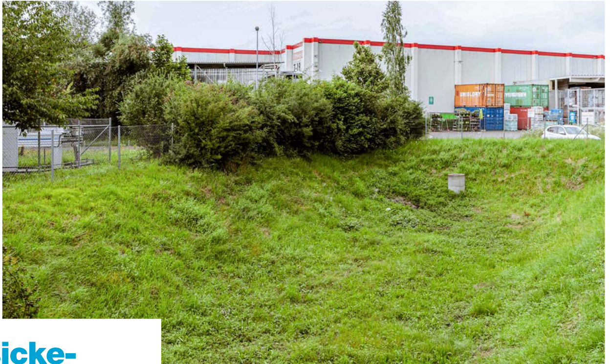
Diese Versickerungsmulde in Schlieren zeigt den grossen Platzbedarf bei herkömmlicher Dimensionierung. «Mutiger» und heute zulässig würde etwa ein Viertel der Grösse genügen. Wichtig bleibt ein kontrollierter Überlauf in die Kanalisation (Schacht hinten).