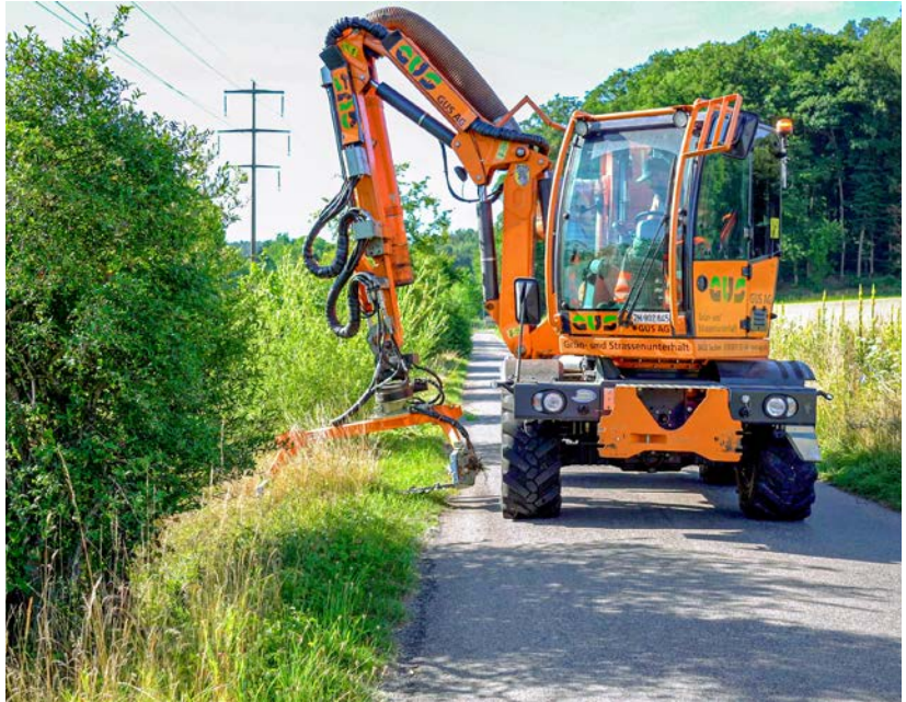
Mit diesem speziellen Mähkopf pflegt die Stadt Bülach ihre Gewässer besonders ökologisch.

Die Stadt Bülach hat bislang drei Vorhaben in drei Massnahmenbereichen umgesetzt (Interview unten). Als Erstes wurde im Bereich Unterhalt und Pflege der ökologische Böschungsschnitt an den Bülacher Gewässern und der Einbau von Fächschienen am Rietbach ausgeführt. Zweitens wurde das bestehende, bereits ökologisch ausgerichtete Handbuch Gewässerunterhalt mit einem Kapitel über ingenieurbioökologische Bauweisen ergänzt. Bei der dritten Massnahme wurde im Auenwald Grauenstein ein Waldweiher neben dem Glatt-Kanal angelegt. In Zukunft möchte Bülach alle Stadtgewässer dauerhaft in die besonders ökologische Pflege überführen.