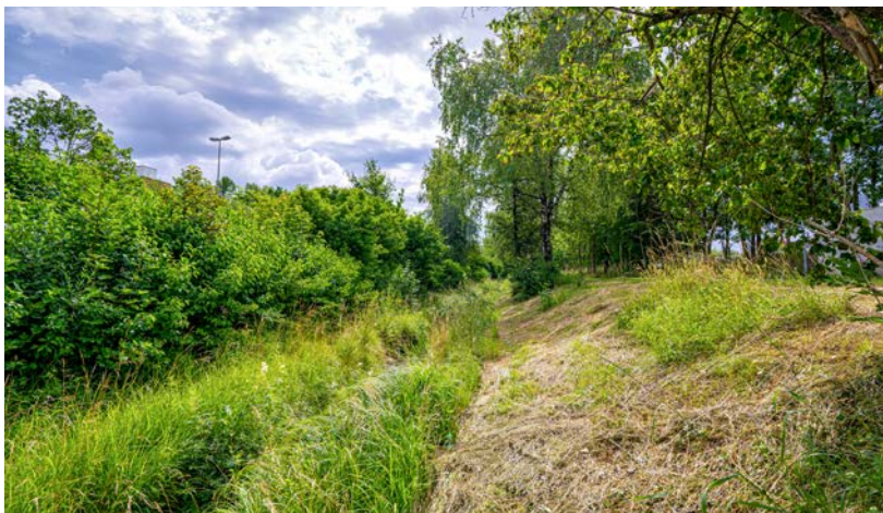
Das Gerinne des Sagentobelbachs in Dübendorf wurde strukturreich gestaltet.

schen Lebensräumen für gefährdete Arten ergänzt werden. Neuartige, innovative Ansätze sind ausdrücklich erwünscht.