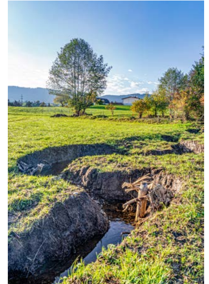
Das kurvenreiche Gerinne am Mattenbach bei Wädenswil wurde von Hand gestaltet.

Eine der 23 Pilotgemeinden ist die Gemeinde Egg (Interview unten). Sie setzte bisher vier Vorhaben in vier Massnahmenbereichen um. Zuerst realisierte sie eine der ersten Gewässerlandschaften, indem sie den Rohrbach in einem Abschnitt neben der Forchautobahn von seinem Korsett befreite. Der Rohrbach ist heute nicht wiederzuerkennen. Zugleich stellt die Gemeinde an einem wertvollen Abschnitt des Vollikerbachs die ökologische Pflege für vier Jahre sicher. Als besonders gewässerreiche Gemeinde setzte sie mit der Erarbeitung des Merkblatts