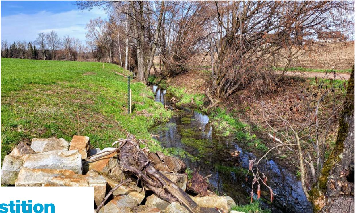
Vielfältiges Gerinne mit ökologischen Begleitstrukturen am Rohrbach bei Egg.